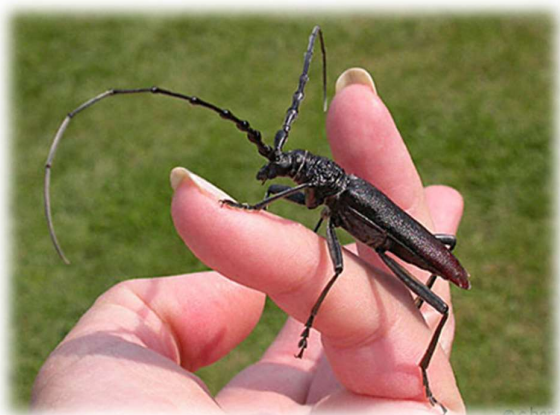
Grand Capricorne ( Cerambyx cerdo )

L'addendum au Règlement vise la préservation à long terme du Grand Capricorne ( Cerambyx cerdo ) et du Lucane Cerf-volant ( Lucanus cervus ) et correspond aux mesures 16 et 16bis du Contrat corridors Lac-Pied du Jura. Ces insectes, strictement protégés au niveau national et européen, évoluent plus particulièrement dans les chênes ou les châtaigniers.