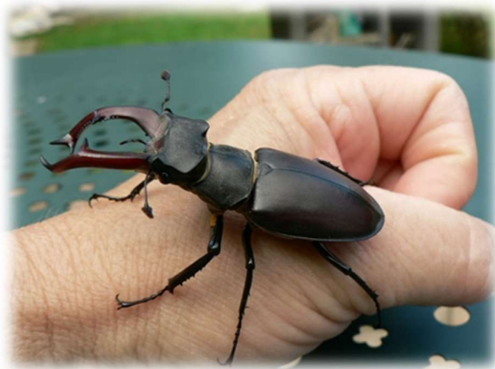
Lucane Cerf-volant ( Lucanus cervus )