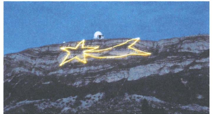
L'Étoile de la Dôle