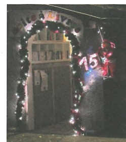
Fenêtre de l'Avent de la boîte à livres 2023