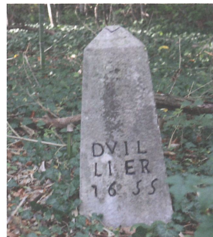
Borne Duillier Nord