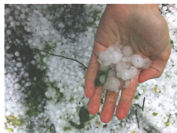
Grêle du 20 juin 2013 à Duillier