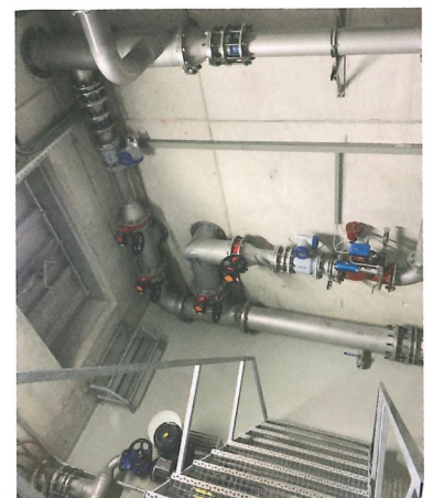
Station pompage Coinsins - Duillier